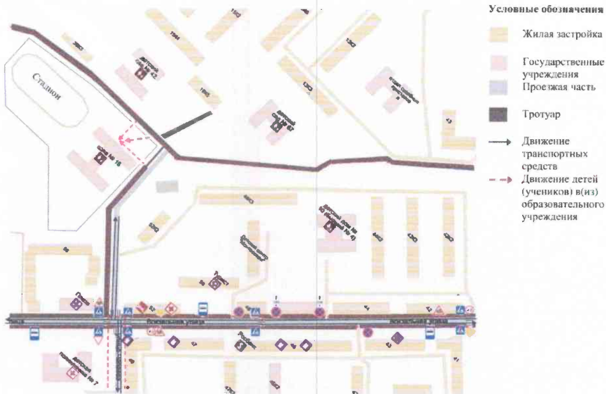
План-схема района расположения ОУ, пути движения транспортных средств и детей (учеников)